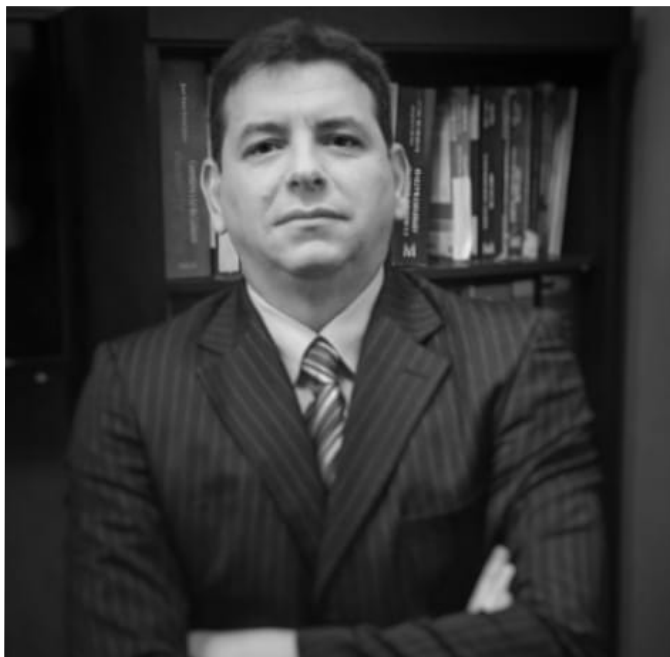
• texto JOSÉ CARLOS PACHECO DE ALMEIDA

Ante às considerações expostas, S.M.J., conclui-se que os produtores rurais e agricultores familiares, suas associações e cooperativas, de que trata a Lei Federal 11.326/2006, foram equiparadas às microempresas e empresas de pequeno porte, nas condições estabelecidas no artigo 3º-A, da Lei Complementar nº 123/2006, gozando, inclusive, dos benefícios relativos às licitações públicas [art. 42 a 49, da LC nº 123/06]. Deste modo, é possível que o Município de [...], por meio de decreto municipal, regularmente na esfera de sua competência, o critério de preferência para as MEs e EPPs sediadas local ou regionalmente, nos termos do §3º do artigo 48, da LC nº 123/06, a exemplo da União, que o fez por meio do Decreto Federal nº 8.538/15. A aplicação da preferência, entretanto, não será automática, cabendo justificar em cada procedimento de licitação a adoção da referida regra regulamentada. É importante que, para eficácia da medida, a Administração Municipal promova um credenciamento prévio das MEs e EPPs sediadas local ou regionalmente para saber, de antemão, se haverá, pelo menos, 3 [três] licitantes do ramo comercial da futura contratação.